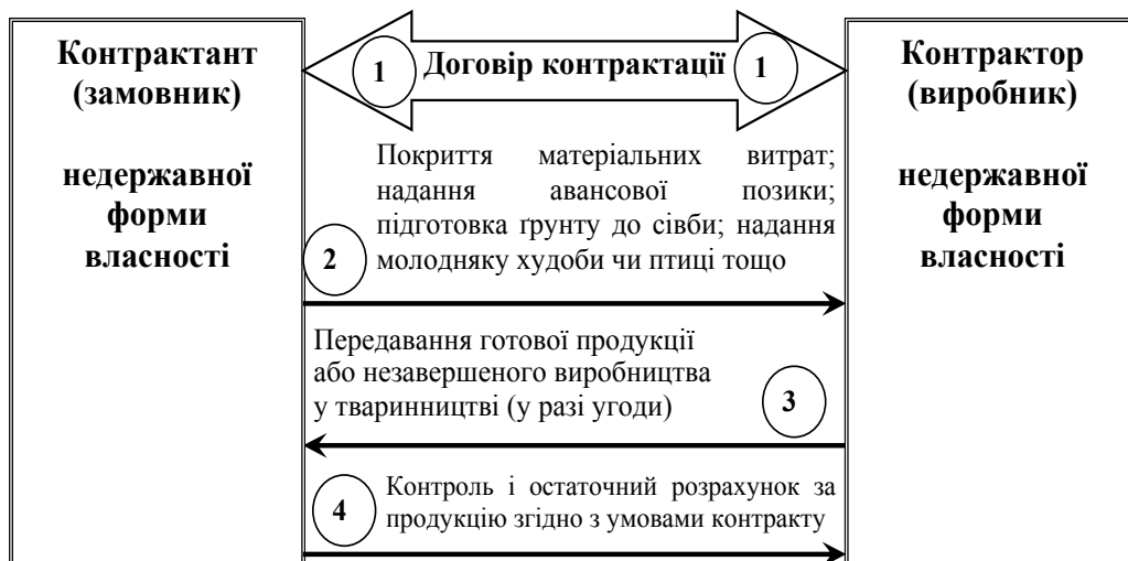
Рис. 2. Концептуальна схема простої виробничої контрактиції суб'єктів недержавної форми власності в аграрному секторі економіки

При цьому виникають два варіанти квазіінтеграційної взаємодії, які різняться між собою за ступенем інтеграції – «м'яка» і «жорстка». За «м'якої» форми контрактної квазіінтеграції виробники сільгосппродукції одержують мінімальне ресурсне забезпечення і авансову підтримку від контрактантів. Вони на власний ризик отримують кредит під заставу майна на ринку кредитних ресурсів, купують необхідні виробничі ресурси і здійснюють виробництво продукції в обсягах і з параметрами, достатніми для виконання умов договору виробничої контрактиції. Їхня взаємодія з контрактантами відбувається здебільшого лише у момент передавання товарів і проведення остаточних розрахунків.