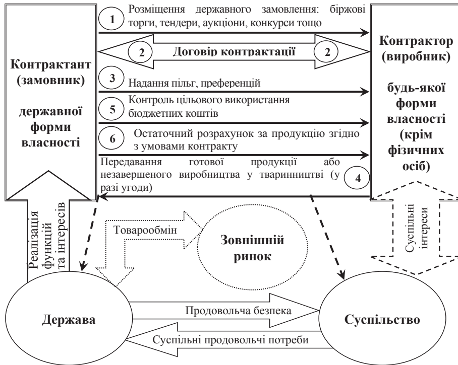
Рис. 4. Структурна модель виробничої контрактации в аграрному секторі економіки за участю держави

У разі якщо контрактом виступає державне підприємство, то виробнича контрактация перетворюється на механізм здійснення державних закупівель сільськогосподарської продукції. При цьому держава реалізує свої стратегічні завдання щодо гарантування продовольчої безпеки, виконання зовнішніх торговельних контрактів чи інших соціально значущих програм секторального розвитку (рис. 4). Сама виробнича контрактация провадиться через розміщення державного замовлення і проведення тендерів, аукціонів, конкурсів.