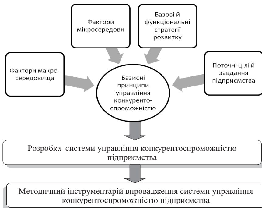
Рис. 1. Схема формування базисних принципів і їх місця в управлінні конкурентоспроможністю підприємства

На наш погляд, визначення й групування різних факторів впливу на управління конкурентоспроможністю підприємства виступають теоретичним підґрунтям, практична реалізація якого має бути відображена у виокремленні базисних принципів здійснення цього процесу. Під принципом розуміється певне правило, сформульоване на основі пізнання законів і закономірностей.