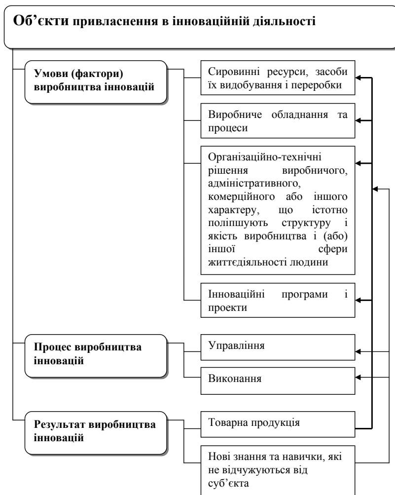
Рис. 1. Види об'єктів привласнення в інноваційній діяльності

(рис. 2). Загальна вигода від інноваційної діяльності 2 , її структура та питома вага в складі прибутку від економічної діяльності є досить цікавим, складним та ще недостатньо розкритим питанням за відсутності розробок та методик розрахунку. Однак за проведеним аналізом можемо констатувати, що з розвитком суспільного виробництва набуває прояву тенденція збільшення питомої ваги загальної вигоди від інноваційної діяльності в складі прибутку економічної діяльності, незважаючи на поліплощинність та дискретність процесу впровадження інновацій. Отже, суб'єкти інноваційної діяльності привласнюють ресурси, процес та результат інноваційної діяльності в межах суспільного виробництва з використанням всіх або окремих його елементів. Саме через процеси привласнення відбувається реалізація їх економічних інтересів.