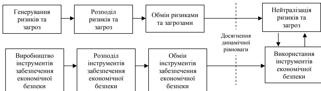
Рис. 2. Фундаментальний цикл процесу відновлення економічної безпеки [10, с. 40]

Фундаментальний цикл економічної безпеки дозволяє розкрити сутність, яка полягає в забезпеченні динамічної рівноваги між ризиками і загрозами, що виникають для економічних суб'єктів та інструментами, що формують суб'єкти, з метою нейтралізації та протидії цим загрозам (рис. 2).