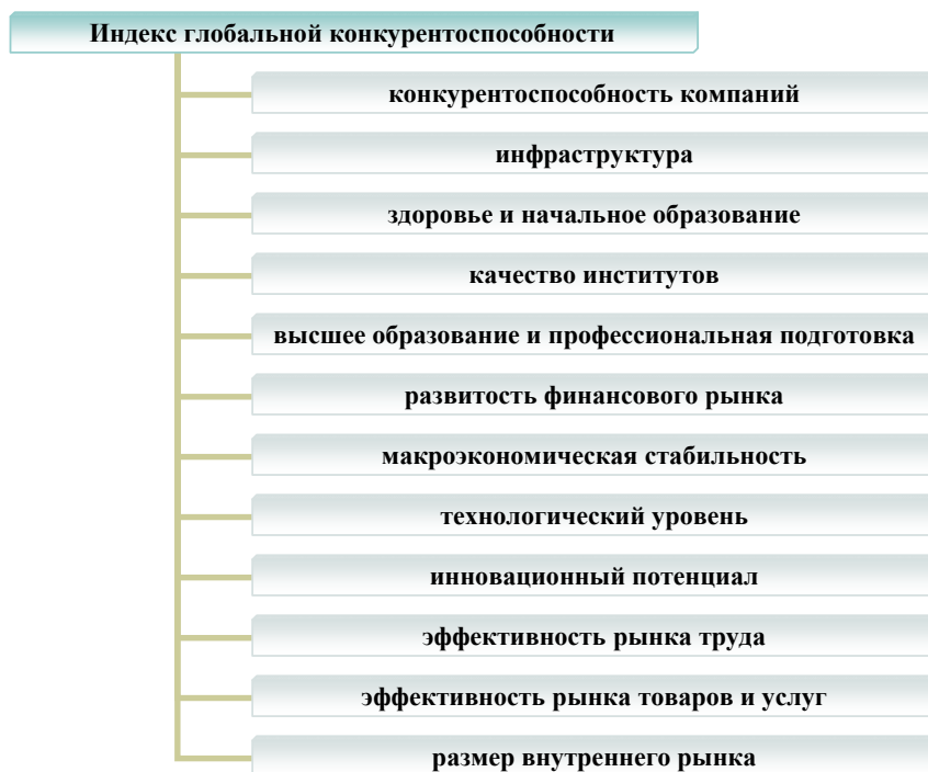
Рис. 1. Параметры Индекса глобальной конкурентоспособности

Формирование конкурентоспособности национальных хозяйств происходит вместе с ростом расходов на научно-исследовательские и опытно-конструкторские разработки. Например, мощное развитие четырех азиатских «драконов» безусловно связано с освоением новых технологий из развитых стран и с разработками и внедрением соответствующих ноу-хау. Современное состояние социально-экономического развития США характеризуется вовлечением научно-технической и инновационной составляющей практически во все формы экономических отношений. США лидируют по затратам на сферу НИ-ОКР (табл. 1) не только по сравнению с Россией, но и в сравнении с другими странами.