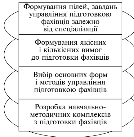
Рис. 2. Етапи управління підготовкою фахівців

Процес управління підготовкою фахівців з різних спеціальностей в освітніх установах системи правоохоронної служби можна подати у вигляді таких етапів (рис. 2).