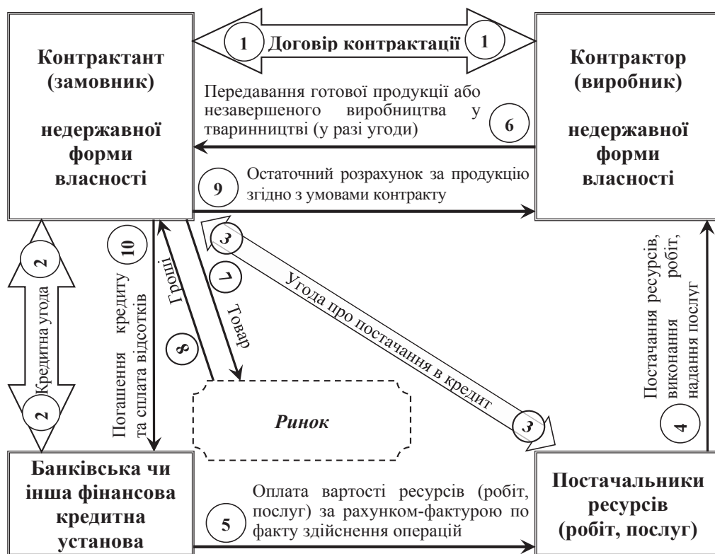
Рис. 3. Структурна модель багатосторонньої виробничої контракції в аграрному секторі економіки

Слід зазначити, що така модель багатосторонньої виробничої контракції має підвищений рівень ризику, який повністю покладається на контрактанта, тим самим істотно збільшуючи його витрати і вартість проекту виробництва сільгосппродукції на замовлення. З іншого боку, контрактант отримує більшу маневреність свого капіталу, який не потрібно акумулювати і виводити з обігу на час виконання умов договору виробничої контракції.