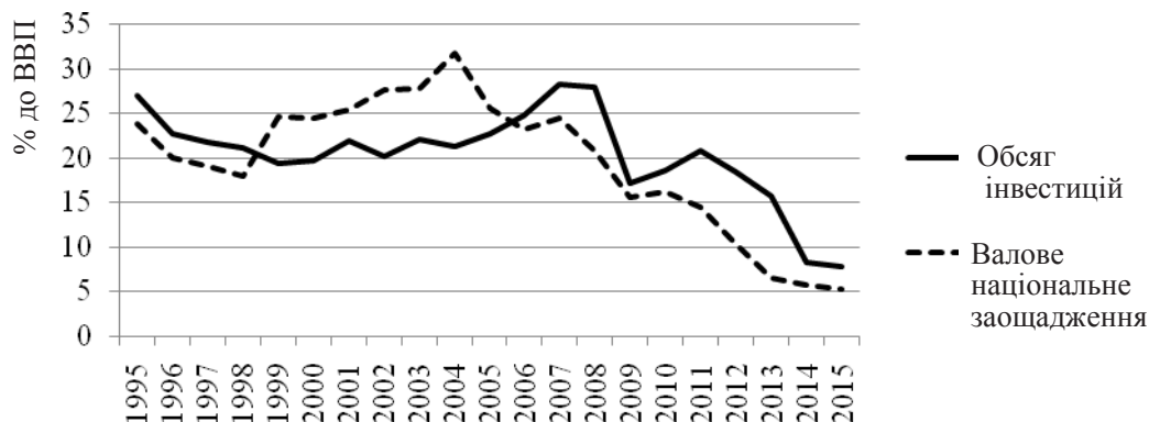
Рис. 2. Динаміка норми інвестицій та норми заощаджень в Україні, 1995–2015 рр.

Побудовано за даними Держстату України ( ukrstat.gov.ua/ ).