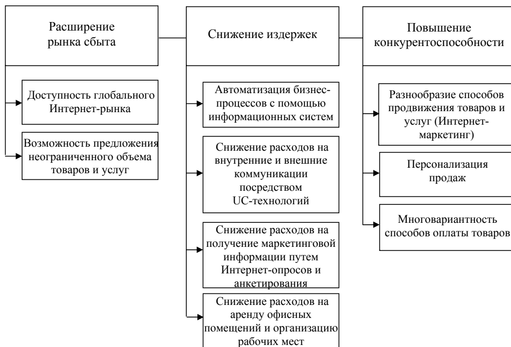
Рис. 3. Возможности повышения эффективности предприятий электронной коммерции в информационно-сетевой экономике

ги жителям других стран. Неслучайно во всем мире наблюдается рост трансграничных электронных покупок. В частности онлайн продажи иностранных ритейлеров в России значительно выросли за несколько последних лет и в 2013 г. достигли 3 млрд долл. [6] (рис. 4);