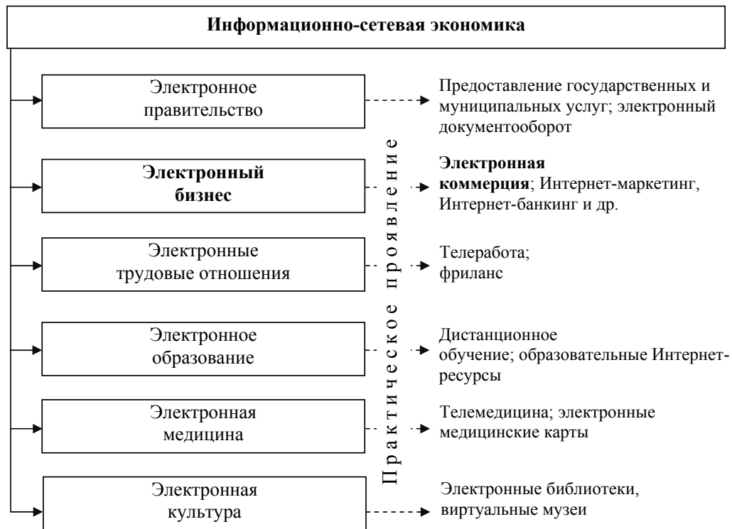
Рис. 2. Структура информационно-сетевой экономики

С точки зрения структурного подхода, наиболее значимыми для общества являются такие составляющие информационно-сетевой экономики, как: электронное правительство, электронный бизнес, электронное образование, здравоохранение и трудовые отношения, электронная культура и др. (рис. 2.)