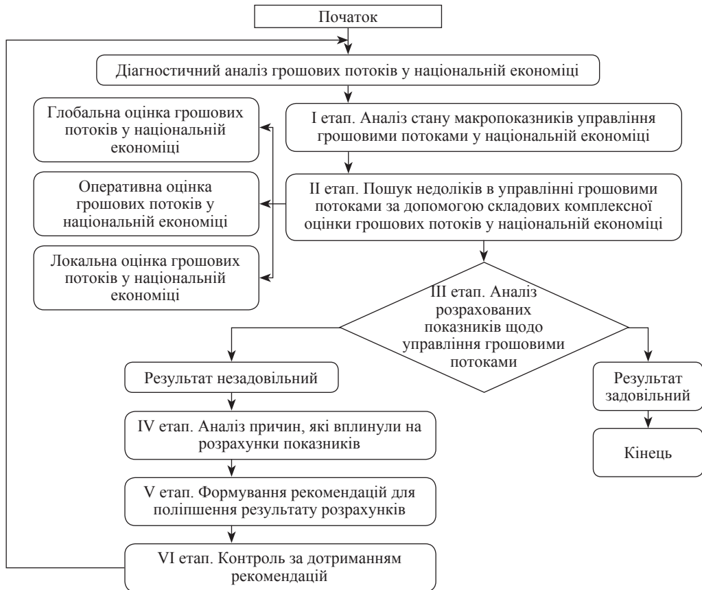
Рис. 3. Модель діагностичного аналізу грошових потоків у національній економіці (авторська розробка)

Таким чином, сформовано модель діагностичного аналізу грошових потоків у національній економіці, яка передбачає трирівневу їх оцінку (глобальний, оперативний та локальний рівні) за індикаторами платоспроможності, рівномірності, синхронності, дефіцитності та збалансованості, що забезпечує комплексну діагностику стану управління грошовими потоками у національній економіці на макро-, мезо- та мікрорівнях.