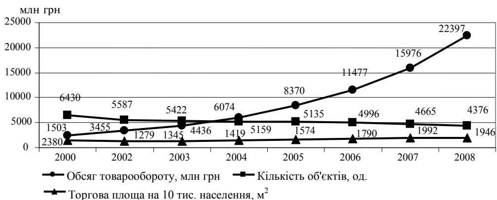
Рис. 2. Динаміка роздрібного товарообороту, кількості об'єктів роздрібної торгівлі і торгової площі на 10 тис. населення у Дніпропетровській області [1, 3]

Дослідження роздрібного товарообороту, кількості об'єктів роздрібної торгівлі і торгової площі на 10 тис. населення у Дніпропетровській області (рис. 2)